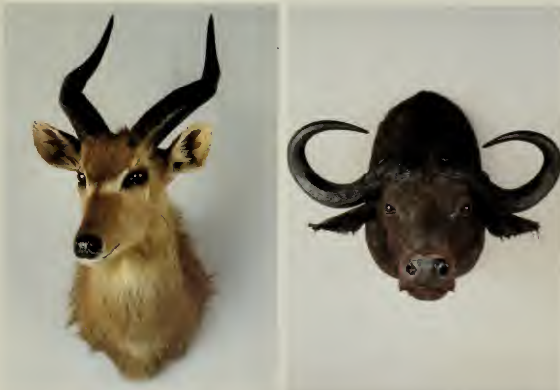
A sinistra: Sitatunga ( Tragelaphus spekei Sclater, 1864); a destra: Bufalo africano ( Syncerus caffer Sparrman, 1779).